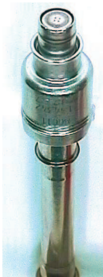
Geschweißtes Einspritzventil (Robert Bosch GmbH)

Das Ziel dieses Projektes ist es, einen neu begründeten Lösungsansatz zu entwickeln, der die Prüfung der Kaltrissigkeit von Rundschweißungen an kleinen Stäben und Rohren ermöglicht. Eine generelle Lösung wäre es, einen praxisrelevanten Test-Aufbau zu entwickeln und umsetzen. Ein solcher Lösungsweg ist unter der Voraussetzung vorstellbar, dass die Prüfung nicht nur zufällige Ergebnisse liefert. Dafür müssen der Aufbau und die Bewertungskriterien theoretisch und simulationstechnisch begründet sein und ihre Einsatzgrenzen klar definiert werden.