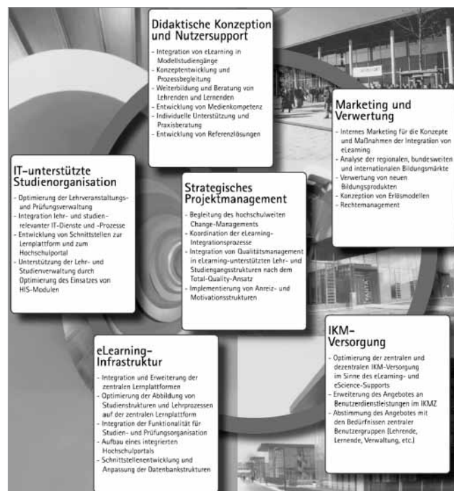
Abbildung 1: Übersicht über die Arbeitspakete des Projektes

Um die Entwicklungen modellhaft voranzutreiben, verfolgt das Projekt das Konzept der Modellstudiengänge. Anhand einiger ausgewählter Studiengänge an der BTU wurden in der Anfangsphase zunächst mit den Studiengangsleitungen sowie einigen ausgewählten Key-Playern, welche das Projekt fachlich und strategisch innerhalb der Fakultäten und der Hochschulverwaltung unterstützen, Präzisierung der Konzepte betrieben sowie den Umfang der Kooperation abgestimmt. Diese befinden sich für den Bereich der Präsenzstudiengänge zunächst in der Integration von eher niedrigschwelligen eLearning-Ansätzen (Distribution von Lehrmaterial und Einrichten von Übungsgruppen über die zentrale Lernplattform) und die Optimierung der Studien- und Prüfungsadministration über die Software-Module der HIS GmbH zu Lehre, Studium, Forschung (LSF) und Prüfungsorganisation (POS). Parallel wurden konkrete Maßnahmen mit den Verantwortlichen einiger Studienangebote an der BTU zur Umsetzung eLearning-basierter Weiterbildungsangebote entwickelt.